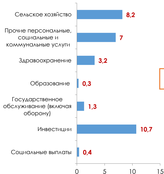
Сокращение номинального уровня расходов по основным статьям в 2017–2019 гг., %